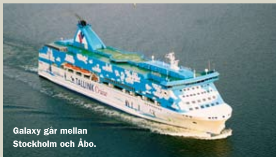
Galaxy går mellan Stockholm och Åbo.

Tallink Silja är också nöjda med uppgraderingen på Stockholm–Riga-ruten, med Festival som gick in på linjen i början av augusti. De ser ett stort intresse för resor till Lettland och anser sig nu ha en bättre produkt att sälja. □