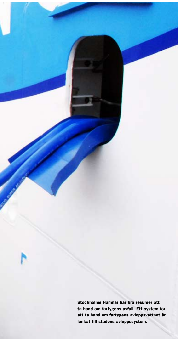
Stockholms Hamnar har bra resurser att ta hand om fartygens avfall. Ett system för att ta hand om fartygens avloppsvatten är länkat till stadens avloppssystem.

der kryssningstrafiken goda möjligheter att göra sig av med avfall.