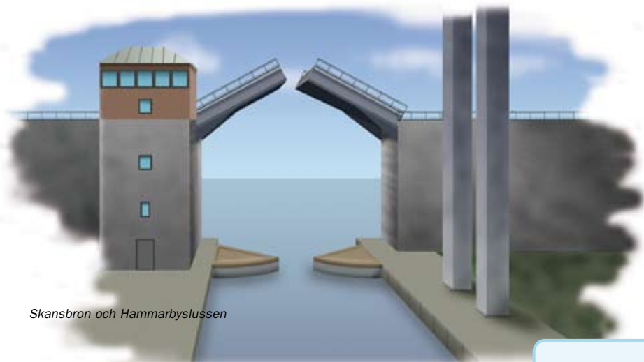
Skansbron och Hammarbyslussen

Fjärrstyrningssystemet är både enklare att sköta och säkrare än den tidigare manuella styrningen av varje bro/sluss. Med hjälp av 26 stycken strategiskt utplacerade övervakningskameror tillhandahåller systemet en heltäckande och överlappande vy av broarna och slussen samt deras respektive påfarter. Operatören kan på så sätt kontrollera att ingen befinner sig på klaffområdet ovanpå bron när bommarna går ned, varken bilar, supersnabba cykelbud eller långsamt flanerande föräldrar med barnvagn.