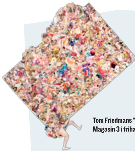
Tom Friedmans "Monster Collage", visades på Magasin 3 i frihamnen under våren.

Stockholms Hamnar, tillsammans med bland annat Fortum, ABB och Stockholm stad, ska fram till april 2011 genomföra en förstudie av smarta elnät i den nya stadsdelen Norra Djurgårdsstaden. Stockholms Hamnars primära del i arbetet är elanslutning av kryssningsfartyg. Läs mer på www.stockholmshamnar.se