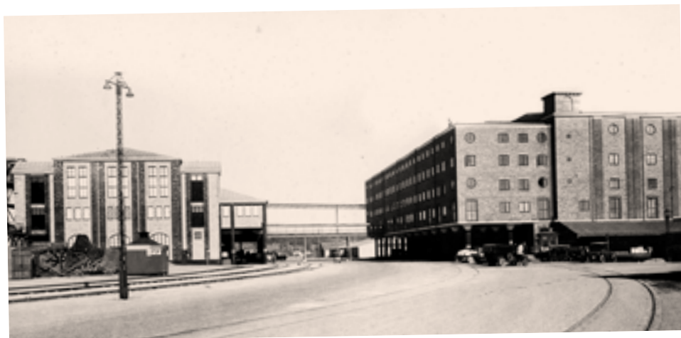
Frihamnen, Magasin I och II. 1931.