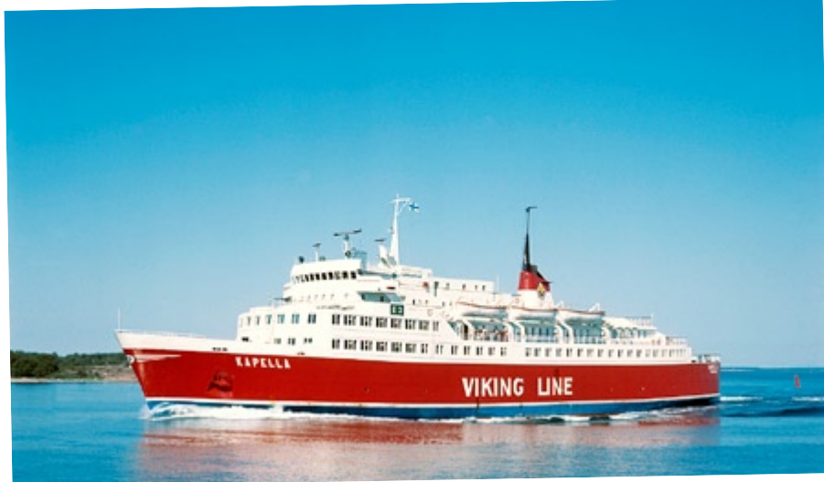
Finlandsfärjan Kapella, fotograferad 1967. Den hade plats för 1 200 personer, 200 bilar och 23 långtradare. Byggd 1967 i Kraljevica, Jugoslavien.