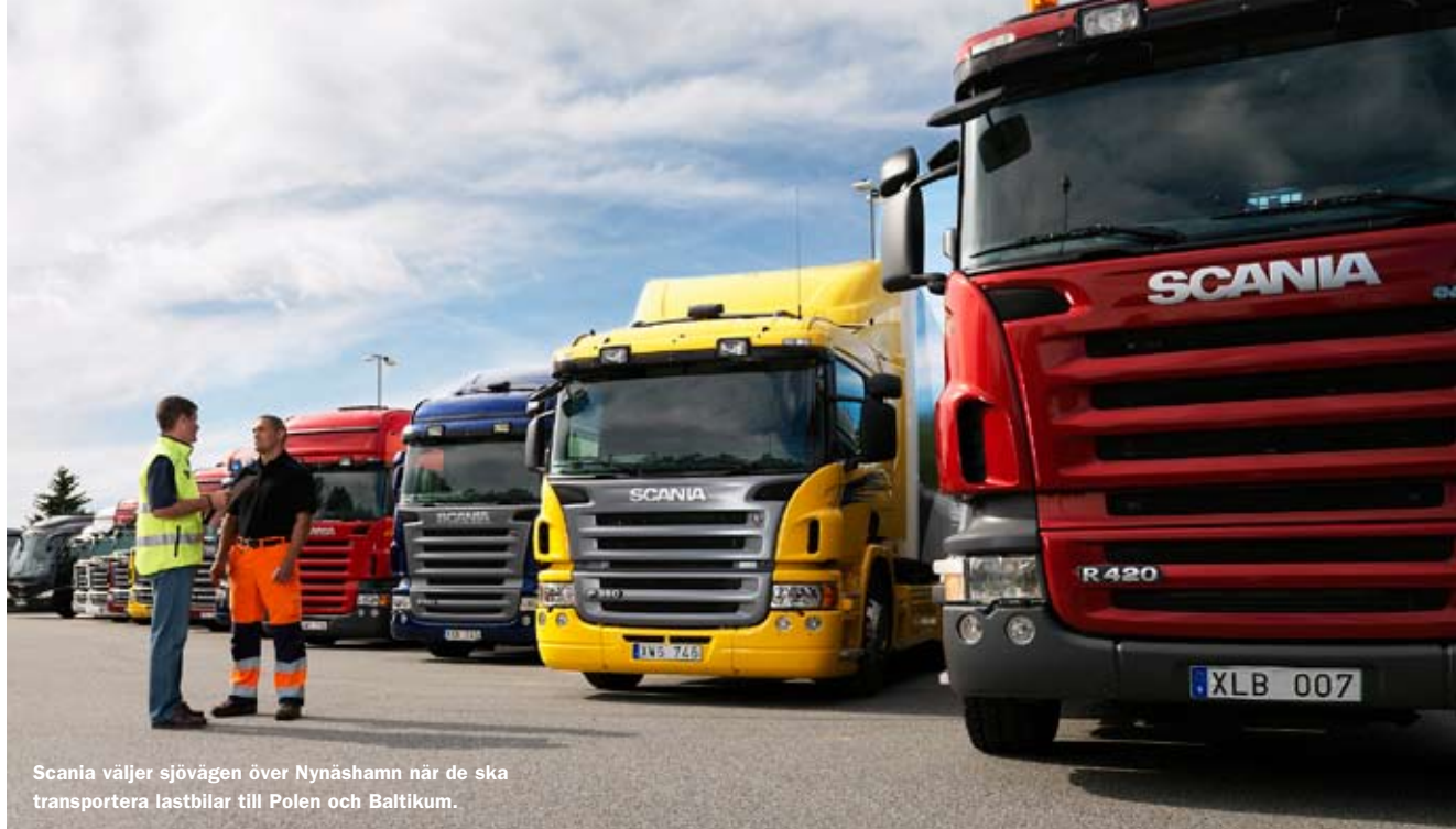
Scania väljer sjövägen över Nynäshamn när de ska transportera lastbilar till Polen och Baltikum.