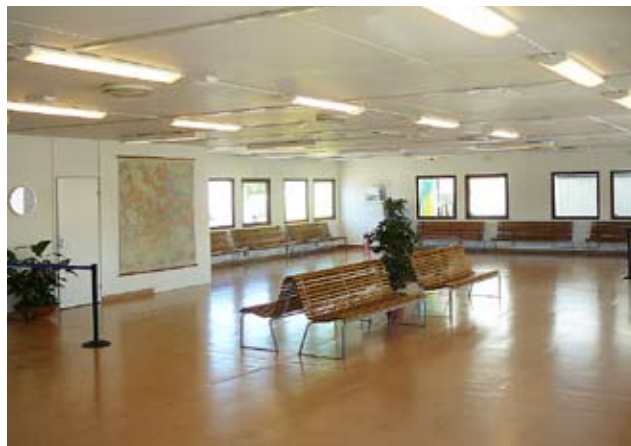
Stockholms Hamnar har utöver den nya kryssningsterminalen i Frihamnen också renoverat en mindre kryssningsterminal vid kaj 650 med taxistopp och säkerhetskontroll.

– Men vi har inte behövt säga nej till något fartyg. Rederierna kan påverka fartygens ankomst lite grand genom att välja till