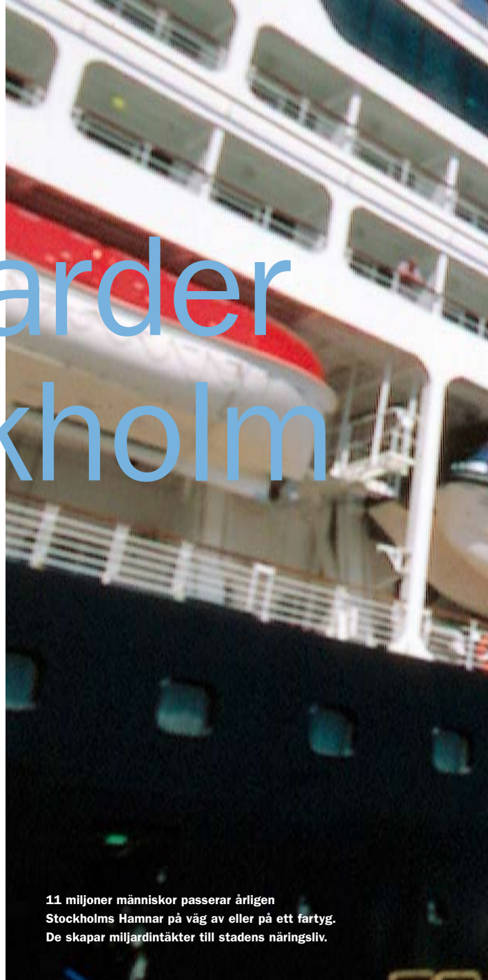
11 miljoner människor passerar årligen Stockholms Hamnar på väg av eller på ett fartyg. De skapar miljardintäkter till stadens näringsliv.

– Även Junibacken lockar många färjeturister, finnländare för-